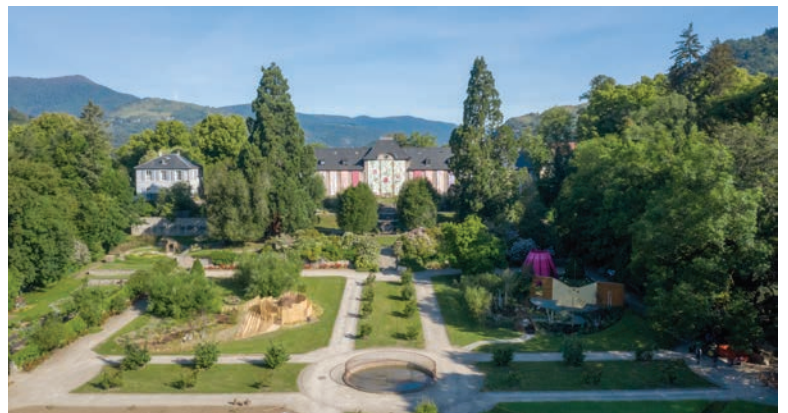
Parc de Wesserling-Ecomusée Textile, vue du ciel sur les Jardins et le Château de Wesserling