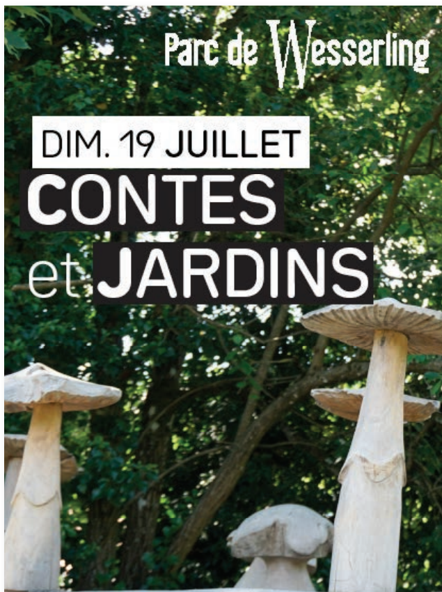
Affiche de notre événement Contes et Jardins du 19 Juillet 2020

Habituellement, l'avant dernier week-end du mois de Juillet se tenait la Fête du Sentier Pieds-nus au Parc de Wesserling. De nombreuses activités autour des sensations des pieds étaient mises en place. Malheureusement, étant donné la situation sanitaire actuelle, il n'était pas possible de mettre en place un tel événement. Le Parc de Wesserling proposera donc un événement autour des contes.