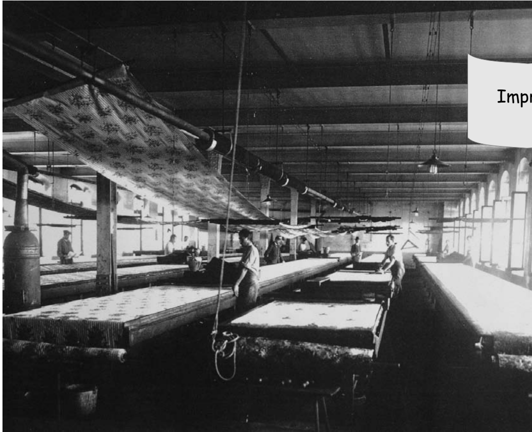
Imprimeur à la planche

D'après les photographies ci-dessous, quel est le métier de ces ouvriers ?